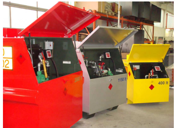
Norm 400, 1150 und 2000 lt