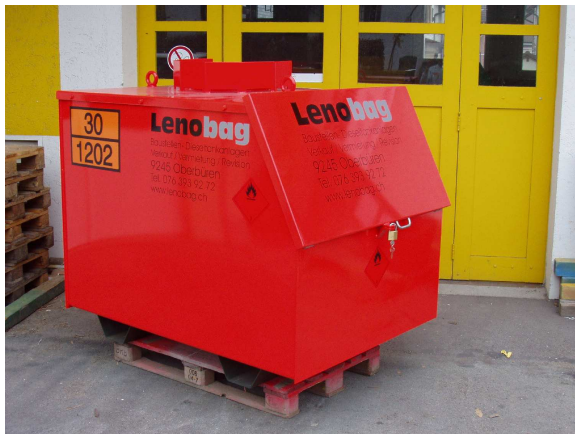
Norm 1150 lt