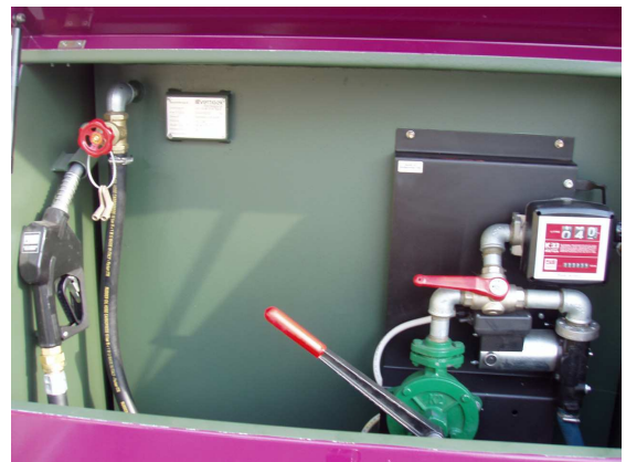
Serienmässig Hand- und Elektropumpe